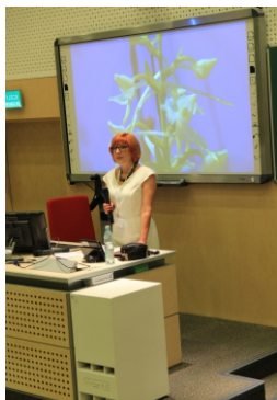
6th International Orchid Workshop Białystok 2018